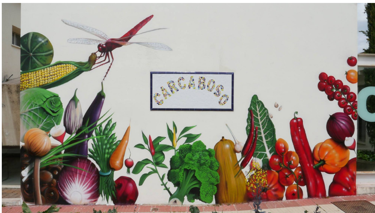
Carcaboso: Chefo Bravo/Agroecología (M.C. 2018)