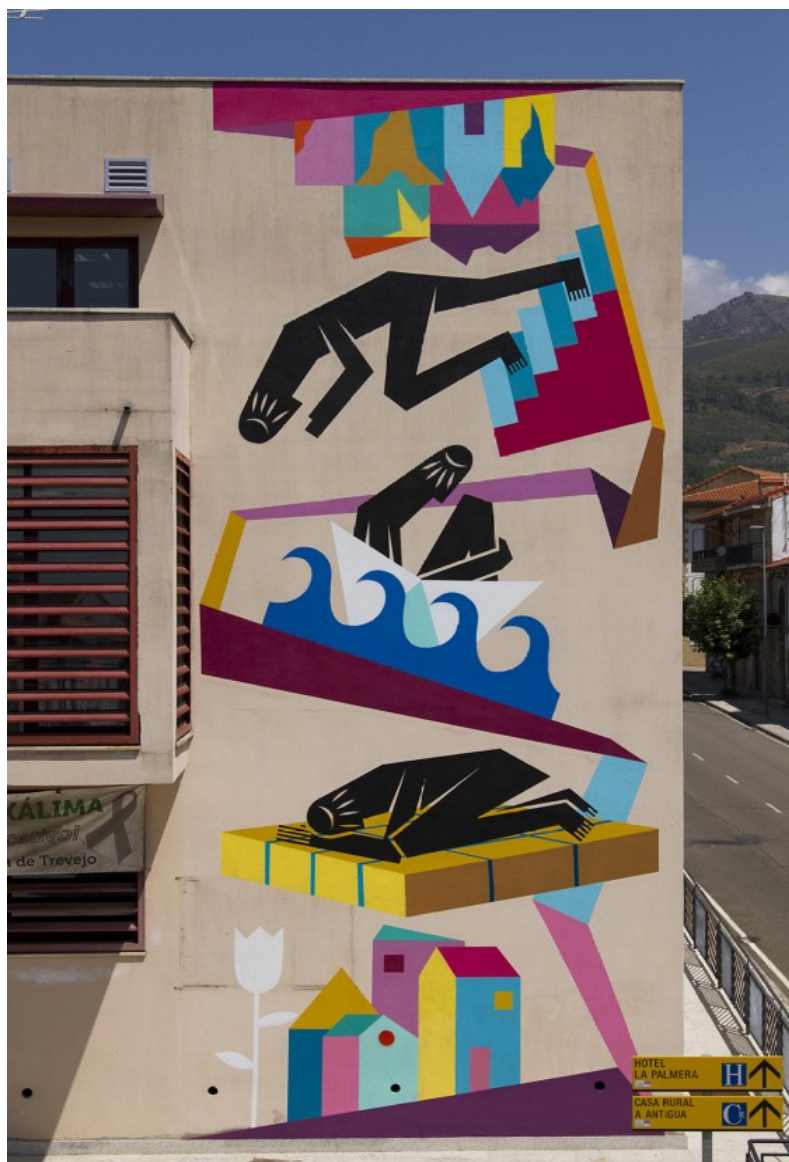
Valverde del Fresno: Digo Diego/Refugiados (M.C. 2017)