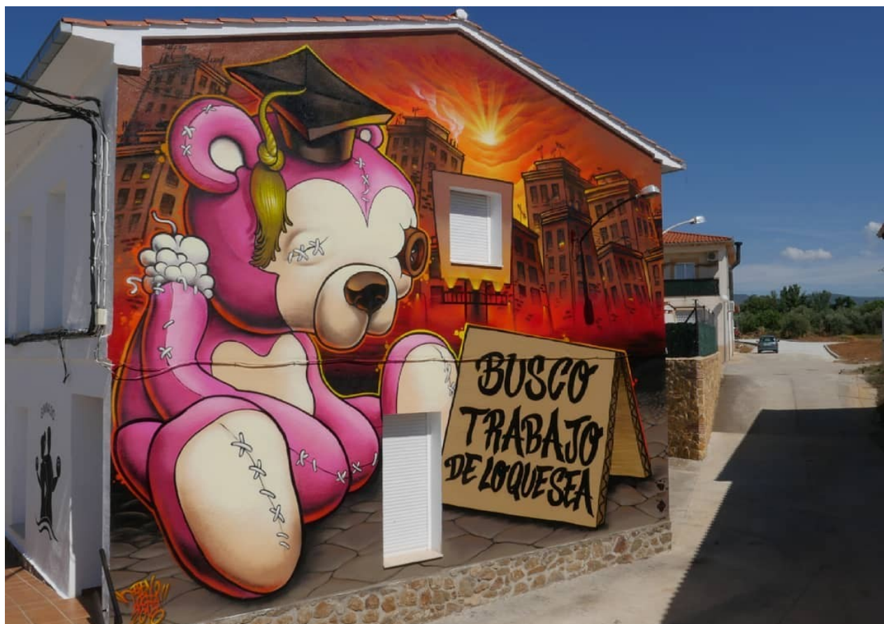
Tejeda de Tiétar: Ben Tocha/Desempleo (M.C. 2018)