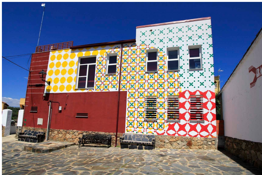
Aceituna: Isabel Flores/Terrorismo (M.C. 2018)