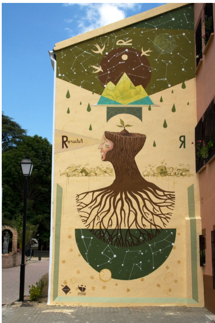
Baños de Montemayor: Jaikü/Reciclaje (M.C. 2016)