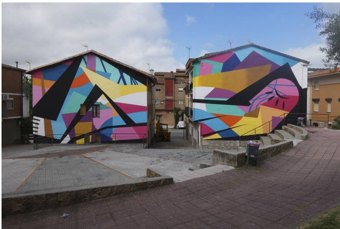
Madrigal de la Vera: Digo Diego/Comunidad versus individuo (M.C. 2018)