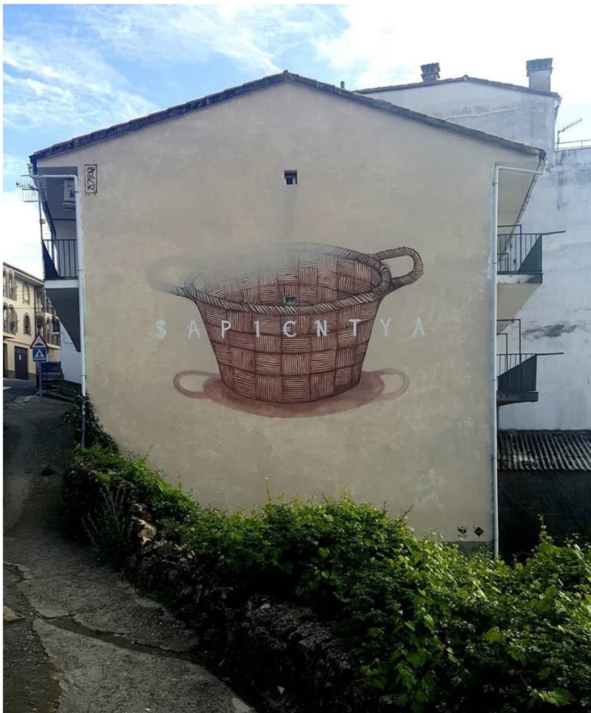
Cabezabellosa: Jaikü/La era del vacío (M.C. 2018)