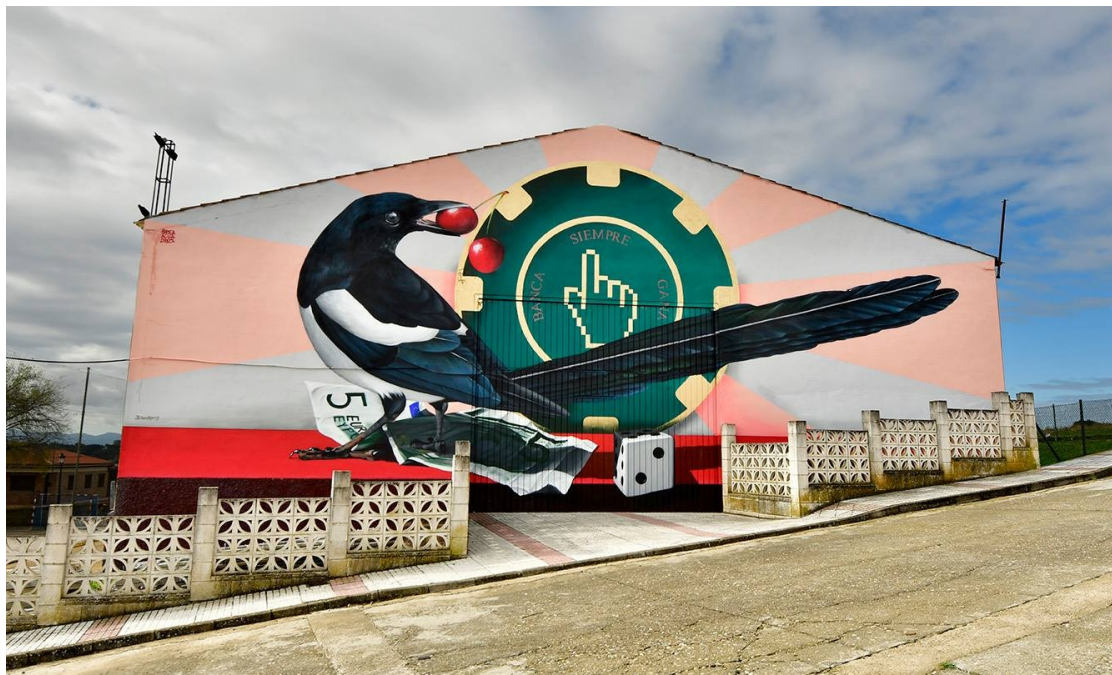
Morcillo: Brea/Ludopatía (M.C. 2018)