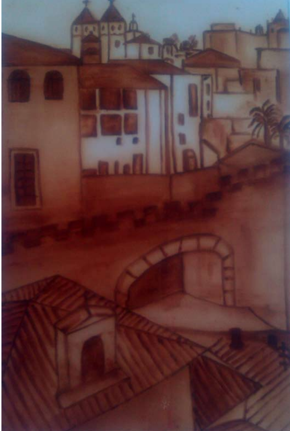
ENTRADA AL AYER 2014 Óleo sobre papel. 50 x 40 cm.