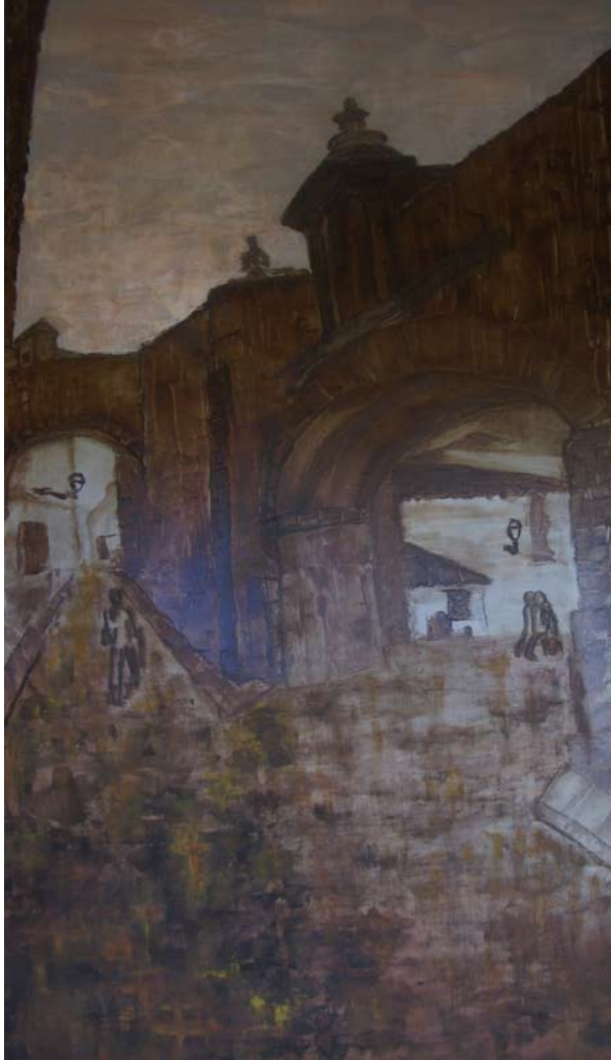
ARCO DE LA ESTRELLA 2013 Óleo sobre lienzo. 90 x 40 cm