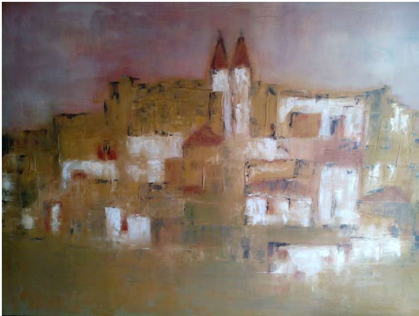
PERFIL HISTÓRICO 2014 Óleo sobre lienzo. 78 x 116 cm.