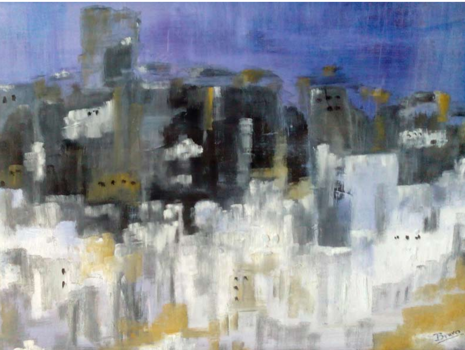
SIN LÍMITES 2014 Óleo sobre tabla. 50 x 80 cm.