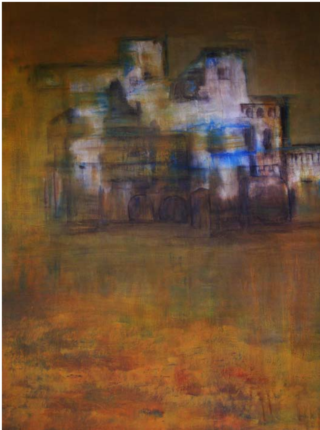
PLAZA MAYOR 2013 Óleo y pigmentos sobre lienzo. 80 x 60 cm.