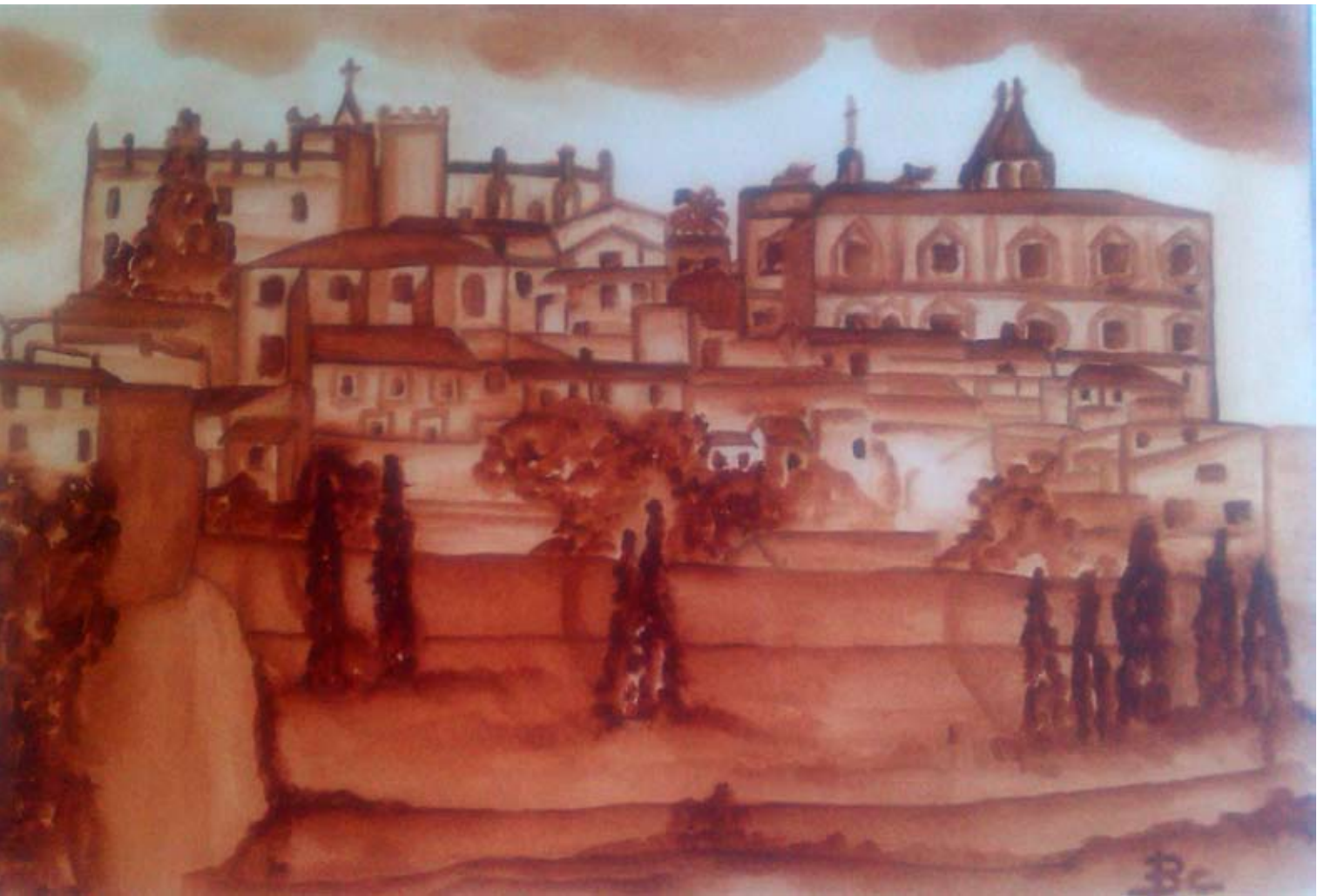
PERFIL SINGULAR 2014 Óleo sobre papel. 50 x 60 cm.