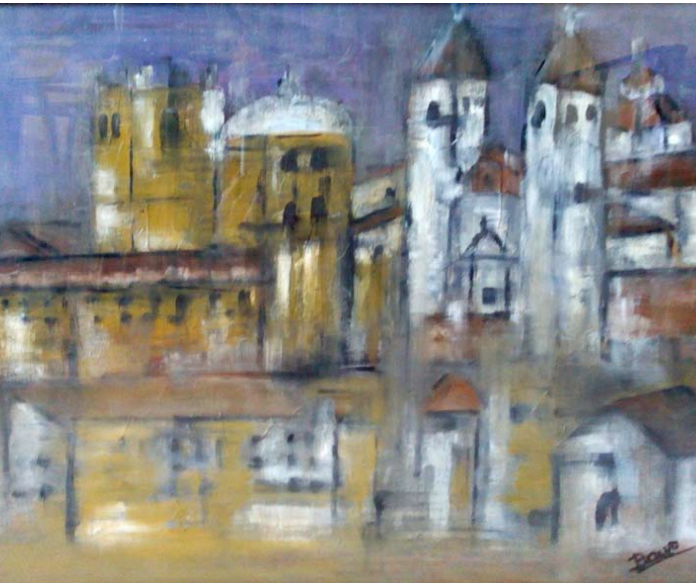
VISTA AL PASADO 2014 Óleo sobre tabla 50 x 60 cm.