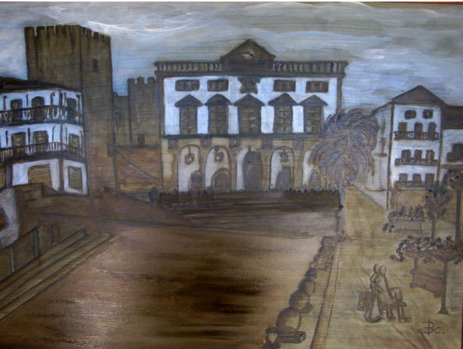
RINCÓN MUNICIPAL 2013 Óleo sobre lienzo. 50 x 70 cm.