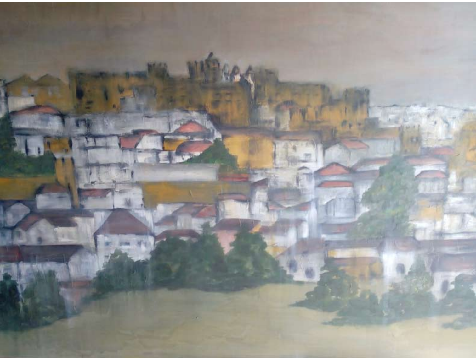
PAHORÁMICA 2014 Óleo sobre lienzo. 78 x 116 cm.