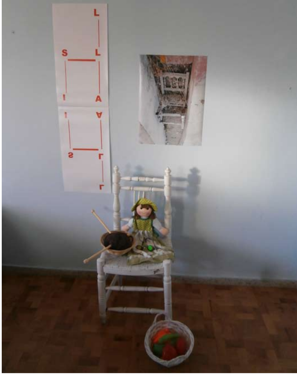
Vicente MACÍAS . 6 Sillas.