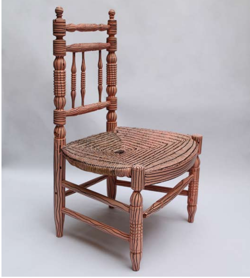
Mercedes POLO PORTILLO, Instinto visual.