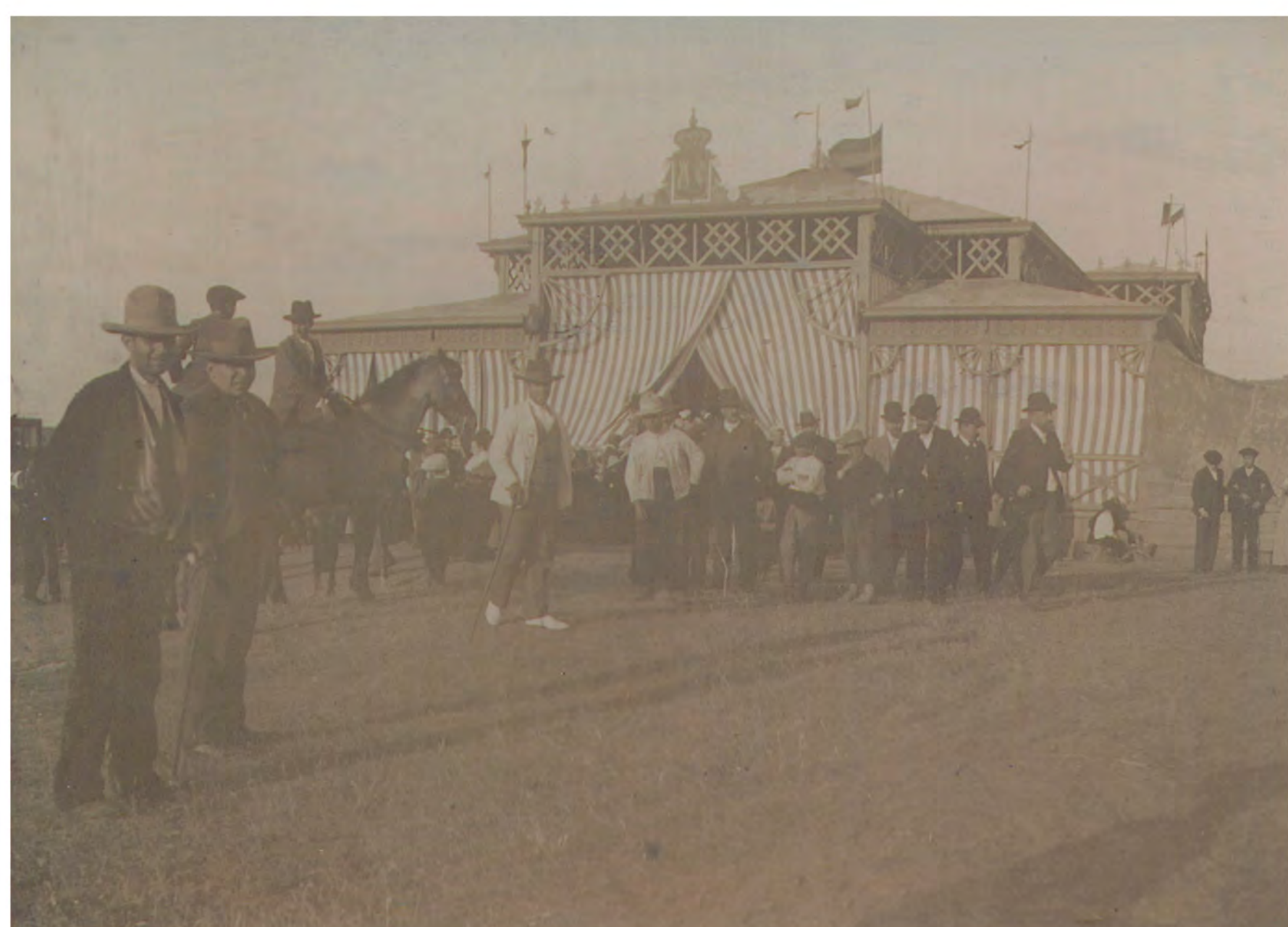
ES . 10037.ADPCC / 04.02.50.FOT.06. // 00303