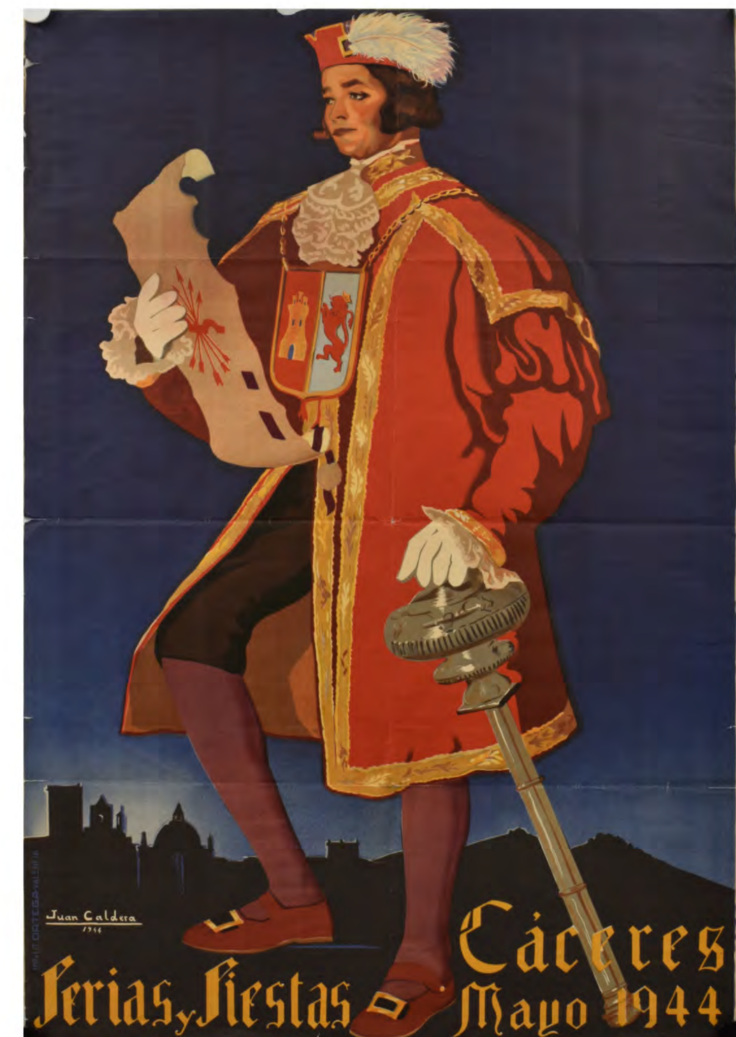
Cartel para las ferias y fiestas de Cáceres en mayo de 1944, firmado por Juan Caldera. ES . 10037-ADPCC / 04.03.54.CAR. // 01726