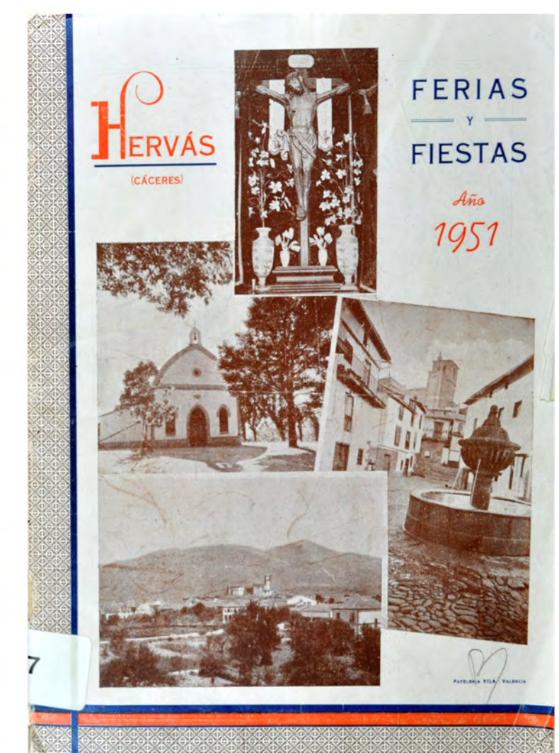
HE HER FER