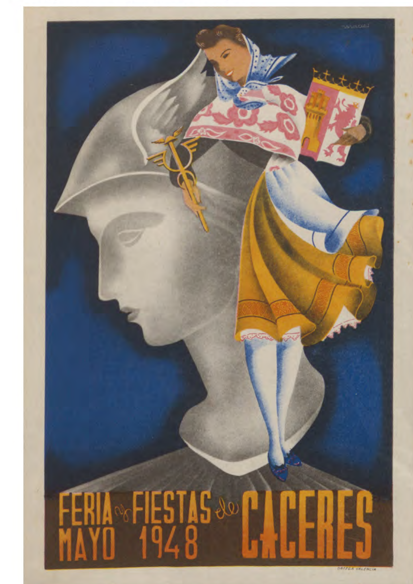
Cartel para las ferias y fiestas de Cáceres en mayo de 1948, firmado por Macías. ES . 10037-ADPCC / 04.03.54.CAR. // 00105