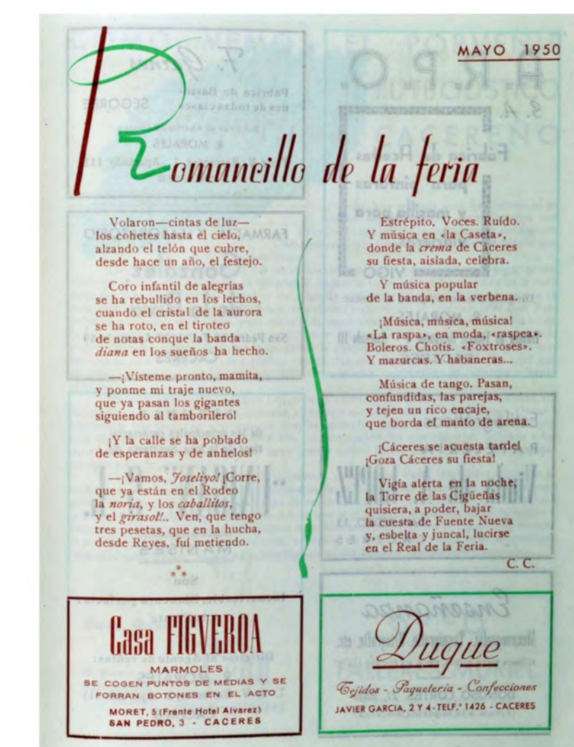
HE CAC FER