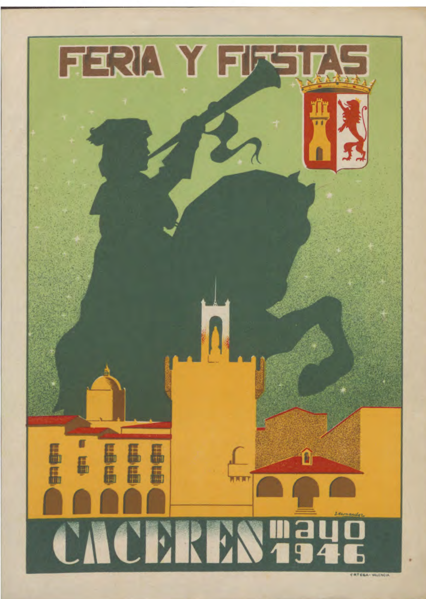
Cartel para las ferias y fiestas de Cáceres en mayo de 1946, firmado por I. Hernández. ES . 10037-ADPCC / 04.03.54.CAR. // 00106