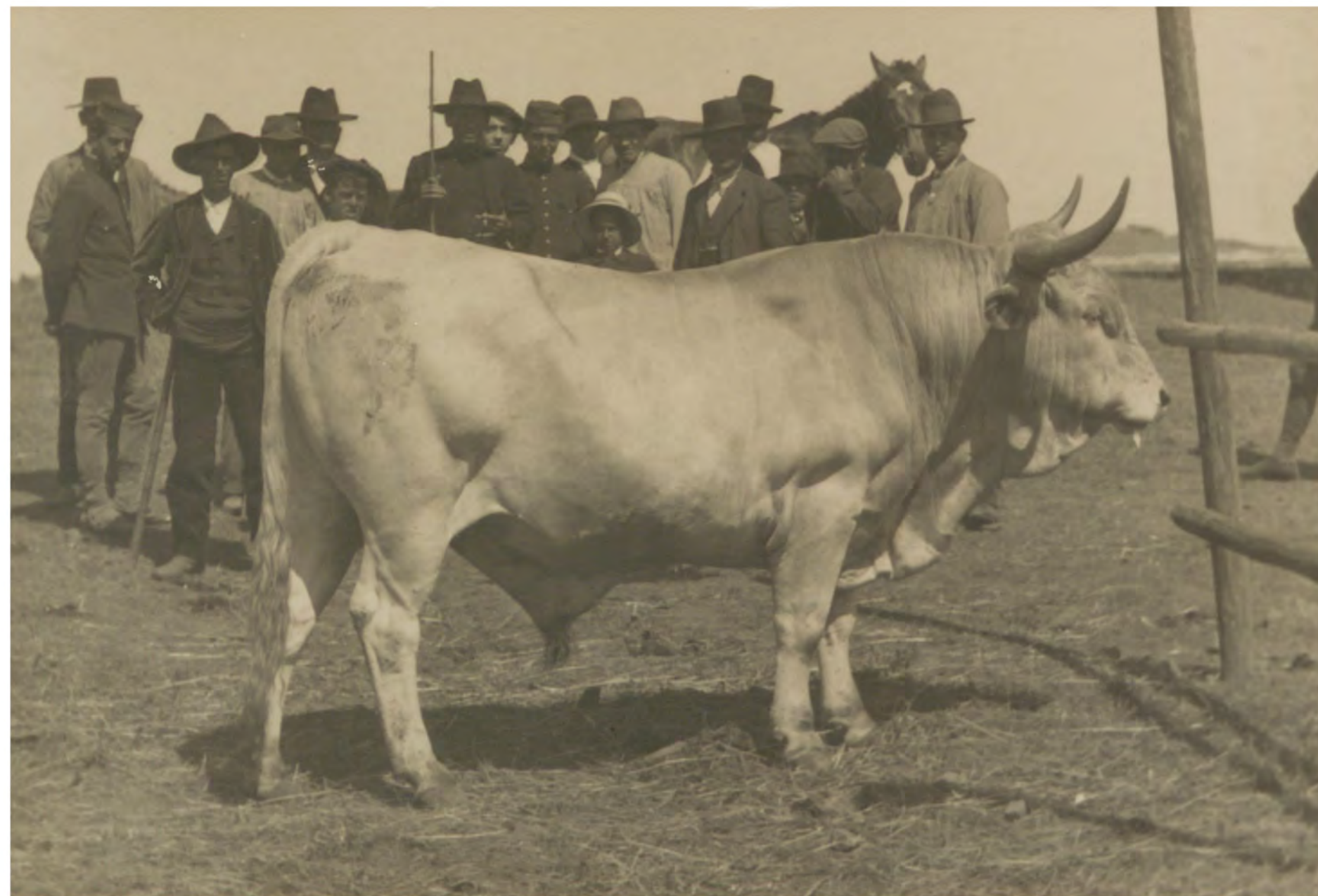
ES . 10037.ADPCC / 04.02.50.FOT.03. // 00157

A la izquierda, tres fotografías tomadas en 1900: vista del Real de la Feria con el convento de San Francisco al fondo, mujer sobre zancos en la calle General Ezponda y caseta del Casino de la Concordia en el Rodeo. En el centro, fotografía del toro de raza extremeña ganador del primer premio del concurso de ganados celebrado en la feria de Cáceres de 1920. Debajo, cartel de toros de la feria de mayo de Cáceres de 1897. Bajo estas líneas, programas de festejos de las ferias de Plasencia, Aliseda, Hervás y Jaráiz de la Vera. La cubierta del programa de Plasencia de 1947 muestra una pareja de montehermoseños en la Plaza Mayor, con el ayuntamiento al fondo; no se ve en el campanario al abuelo Mayorga, que fue retirado en 1936 y no volvería a dar las campanadas hasta 1973. Abajo del todo, a la derecha, página interior del programa de festejos de la feria de Cáceres de 1950, con un poema firmado por C. C. Aunque no figurará en las antologías de los mejores poemas de la lengua castellana, alguna información ofrece sobre las costumbres de la época.