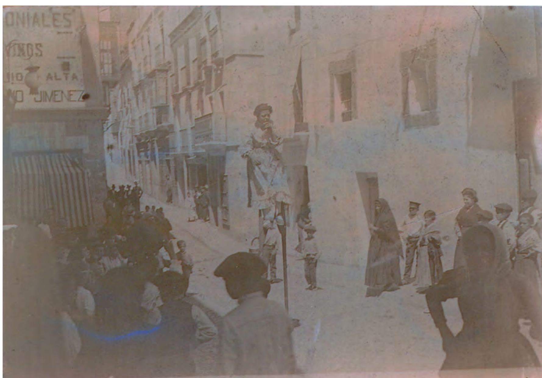
ES . 10037.ADPCC / 04.02.50.FOT.06. // 00302