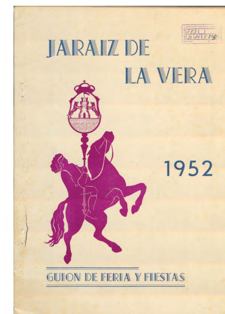
HE FIE TAB