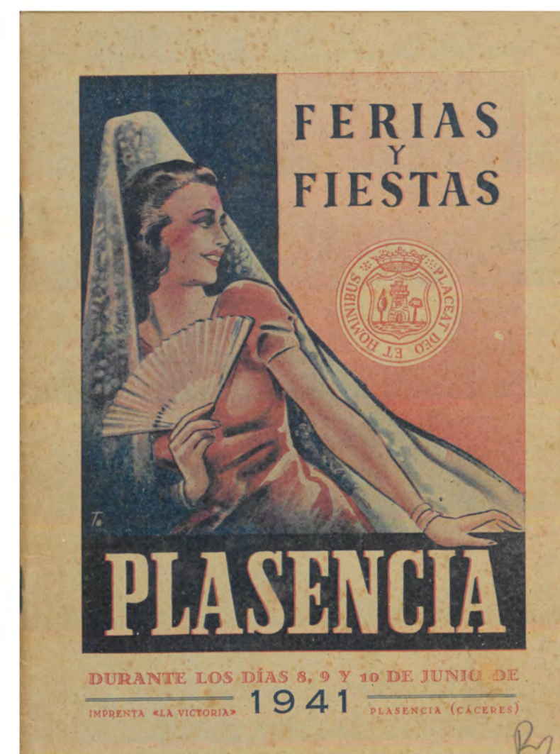
HE PLA FER