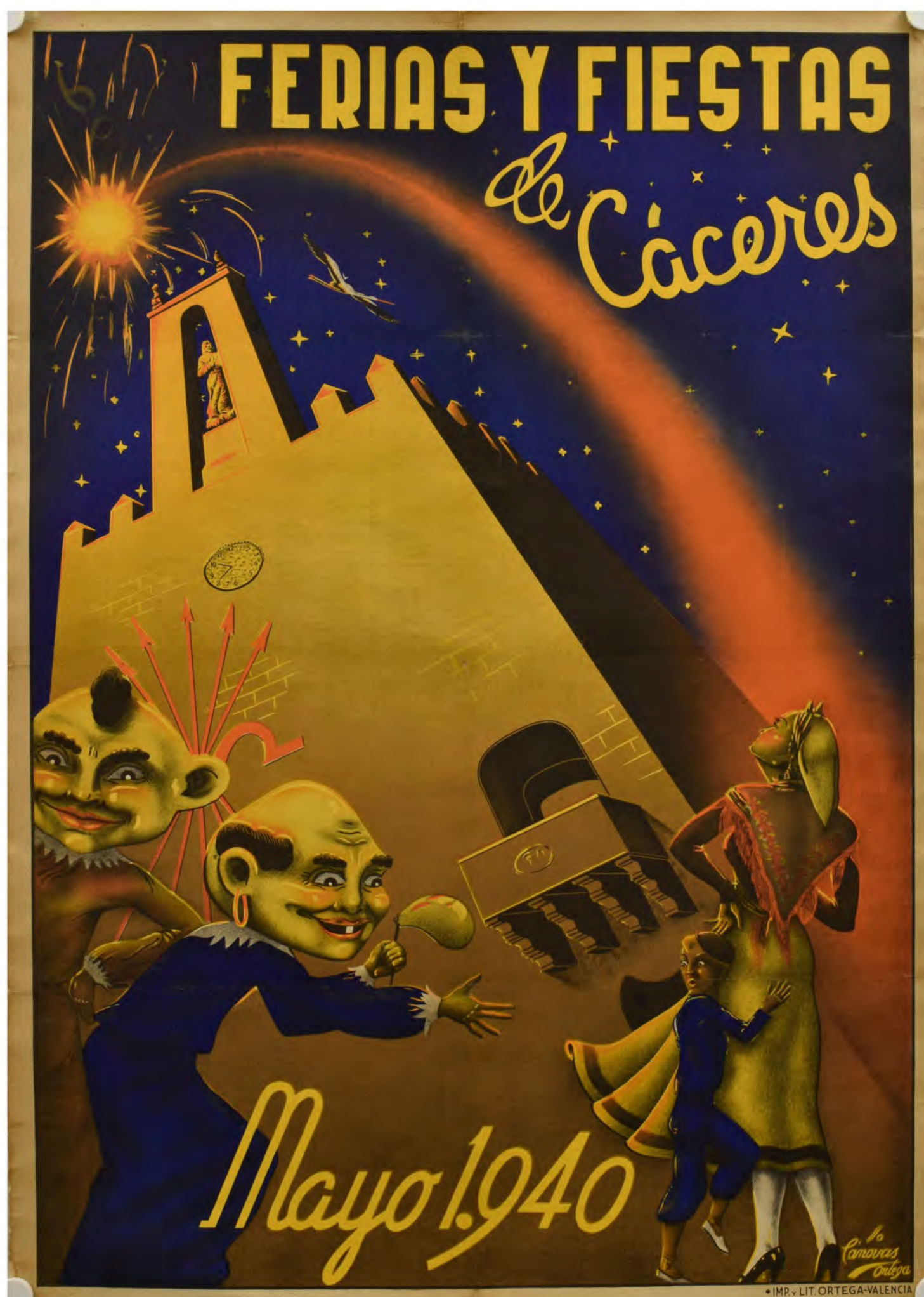
Cartel para las ferias y fiestas de Cáceres en mayo de 1940, firmado por Cánovas. ES . 10037-ADPCC / 04.03.54.CAR. // 01730

Estos brutales antecedentes de la Casa del Terror y el Tren de la Bruja dejaron de tener efecto hace mucho tiempo. También el ganado fue perdiendo protagonismo, hasta que la feria fue para la mayoría de la gente solo la diversión vertiginosa de unos días, la verbena, los churros, el pollo a precio de caviar, las casetas de tiro y las carreras de camellos majaretas, la noria cada vez más alta, la música de los coches chocones retumbando en el diafragma y el imparable cotorreo de las tómbolas, que han legado dos personajes irrepetibles a la colección de tesoros y cachivaches familiares: el perrito Piloto y la muñeca Chochona.