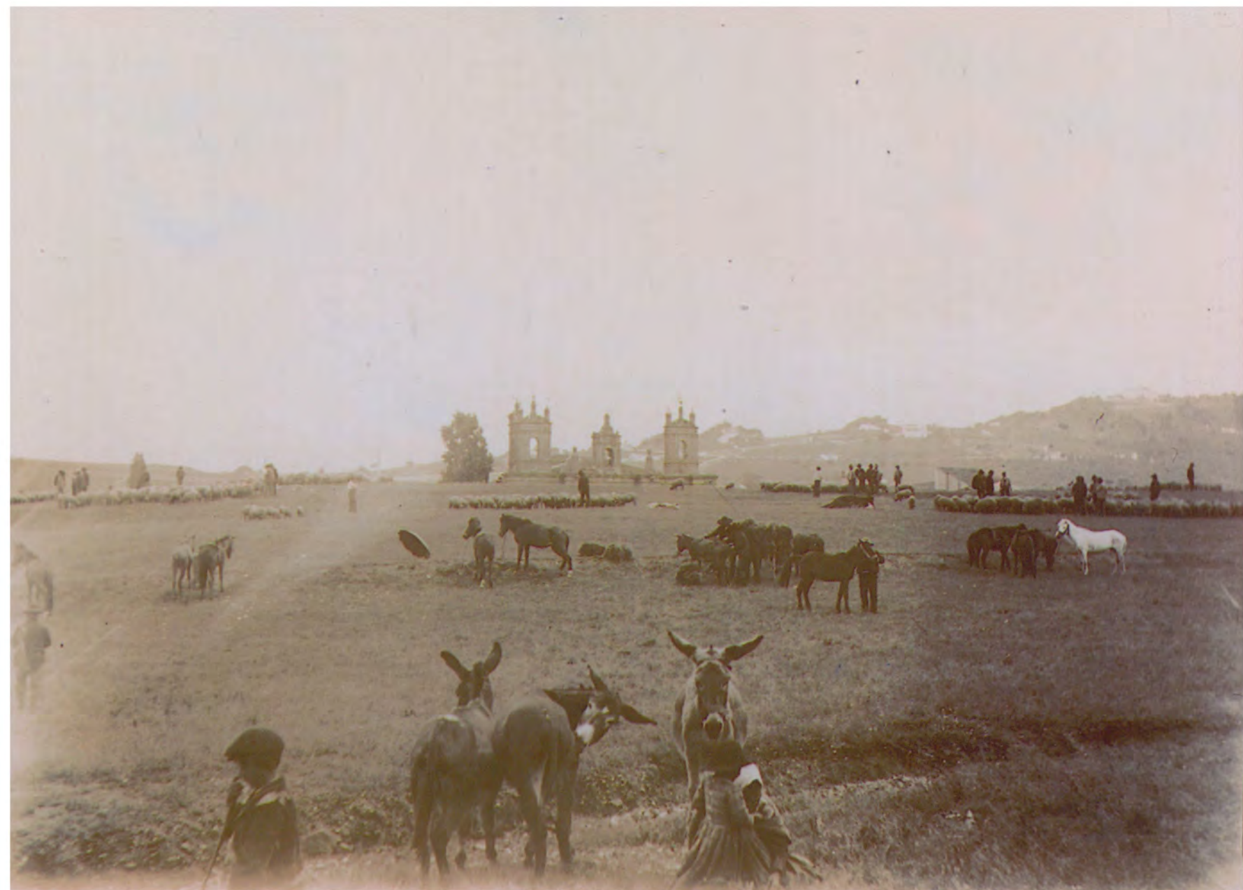
ES . 10037.ADPCC / 04.02.50.FOT.06. // 00300