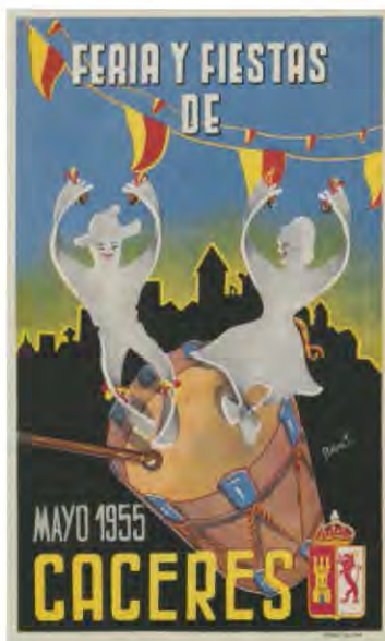
Cartel para la feria de Cáceres (mayo de 1955), firmado por Rafael S.